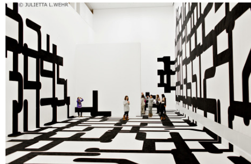
Schulprojekt Raum im Anzug in der Berlinischen Galerie