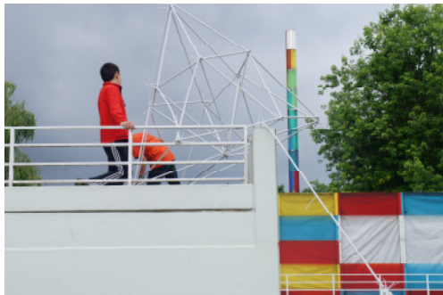
Sommerprojekte im Bauhaus-Archiv und im Museum Europäischer Kulturen

In einigen Veranstaltungen arbeiteten Kinder und Jugendliche mit und ohne körperliche Einschränkungen zusammen. Es wurden insgesamt acht Integrationskurse durchgeführt.