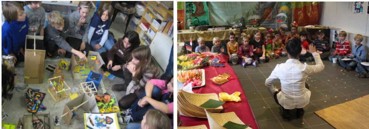
Schulprojekt „Raum im Anzug“ in der Berlinischen Galerie und Globales Lernen im Ethnologischen Museum.