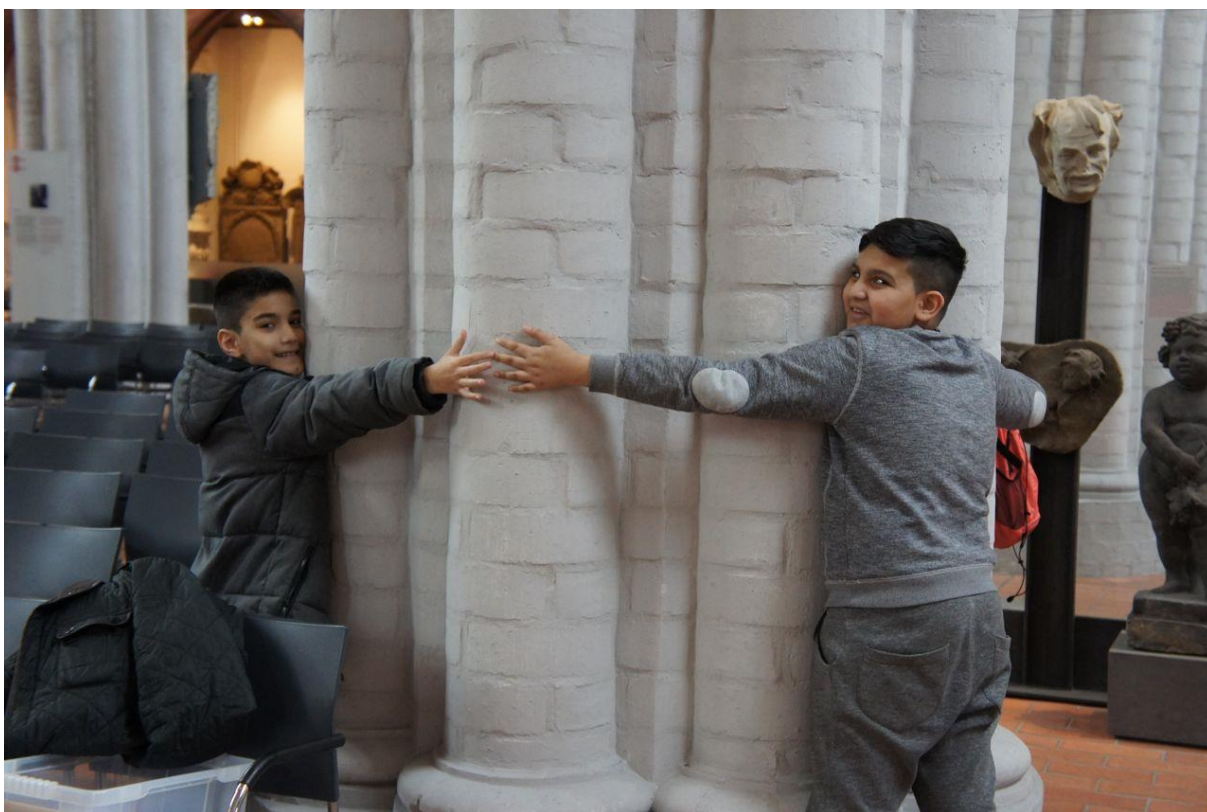
Foto: Nils Hauer (2016): Schulprojekt ARCHITEKTUR-MEMORY in der Nikolaiirche

In Kooperation mit der Berlinischen Galerie konnten ebenfalls langfristige Partner mit der Hermann-Hesse-Schule und dem Robert-Koch-Gymnasium geknüpft werden. Für beide Schulen wurden Kunst-AGs überwiegend im Atelier Bunter Jakob durchgeführt.