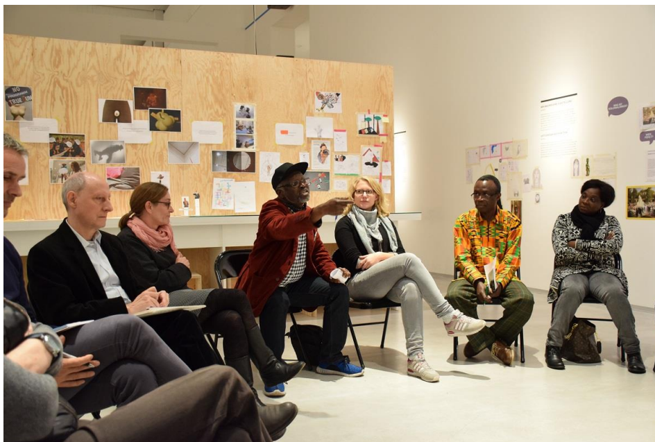
Foto: Michaela Englert (2016), Diskussionsrunde mit MultiplikatorInnen aus Ländern Afrikas mit dem Kurator der Ausstellung DADA AFRIKA. Die Veranstaltung fand im Rahmen des Projekts WENN DINGE SPRECHEN statt.

In einigen Veranstaltungen arbeiteten Kinder und Jugendliche mit und ohne körperliche Einschränkungen zusammen. Es wurden insgesamt acht Integrationskurse durchgeführt.