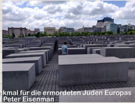
Denkmal für die ermordeten Juden Europas von Peter Eisenman