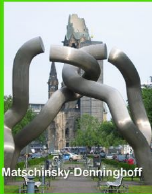
Berlin von Matschinsky-Denninghoff