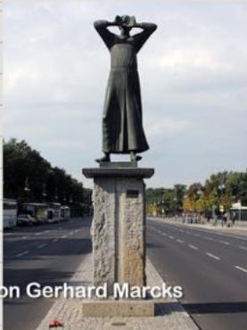
Der Rufer von Gerhard Marcks