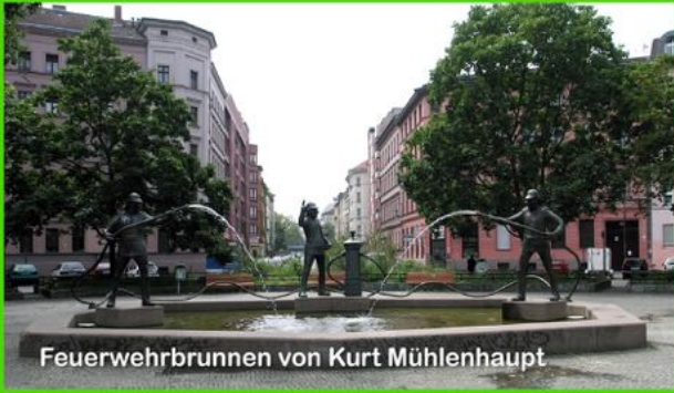
Feuerwehrbrunnen von Kurt Mühlenhaupt