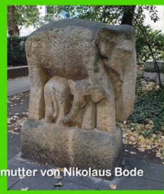
Elefantenmutter von Nikolaus Bode