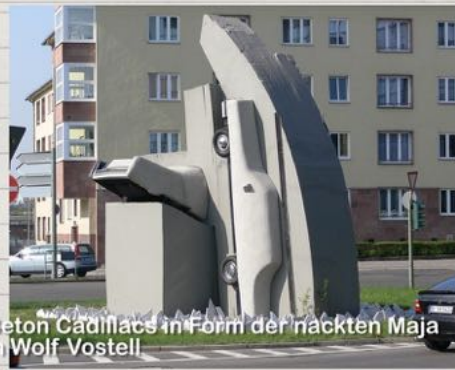
2 Beton Cadillacs in Form der nackten Maja von Wolf Vostell