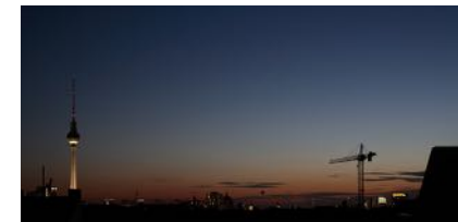
Der Himmel über Berlin