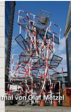
Randaldenkmal von Olaf Metzel