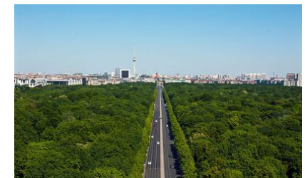
Eine grosse Strasse