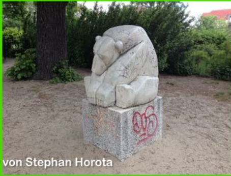
Bär von Stephan Horota